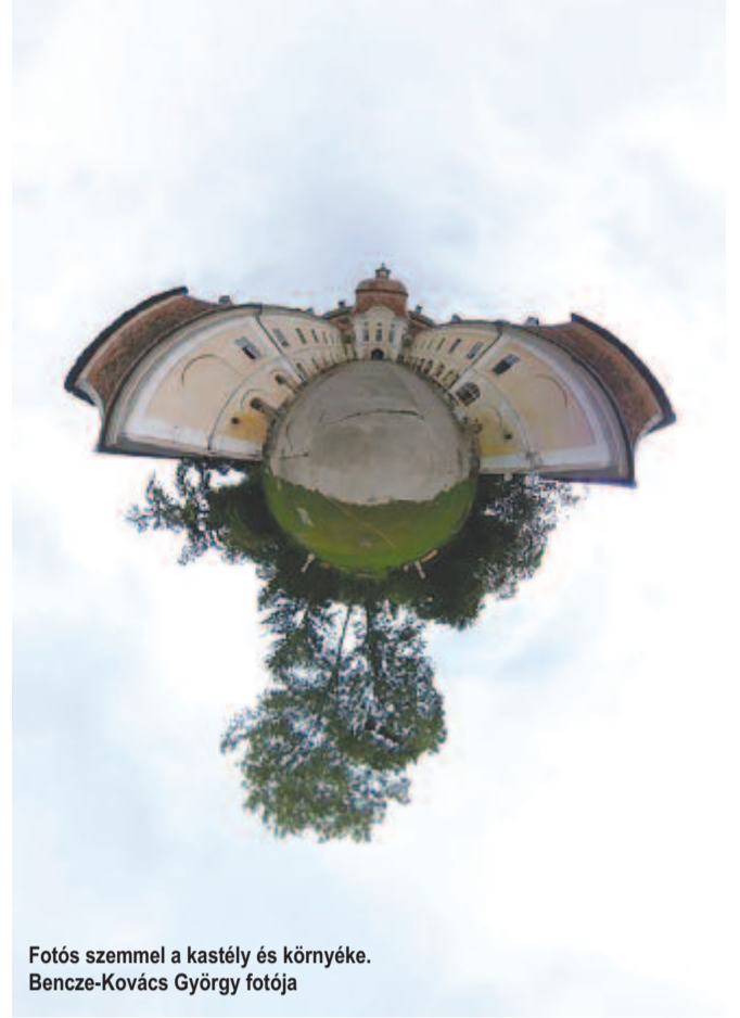
Fotós szemmel a kastély és környéke.

– Nem csak itt, egyébként is foglalkozom vele. Mondta is az egyik társam, hogy ezek szerint engem nem véletlenül hívtak ide. Jól is érzem itt magam, nagyon kellemes a munka s a közös időtöltés. Erdélyben még Székelyudvarhelyen és Oroszhegyen jártam egy röpké kirándulásnyi időre, de itt most sok mindentől ízelítőt kapunk. A kastélyban érzékelhető egy egész korszak. Varázsos a hangulata. Úgy jöttem, hogy az eltervezett témát akár otthon is megfesthettem volna, de itt kinéztem az ablakon, és annyira konkrét volt az, amit láttam, annyira megtetszett, hogy egyből döntöttem, az elképzelt képi játékot ezekkel valósítom meg. Aztán ha ezek elké-