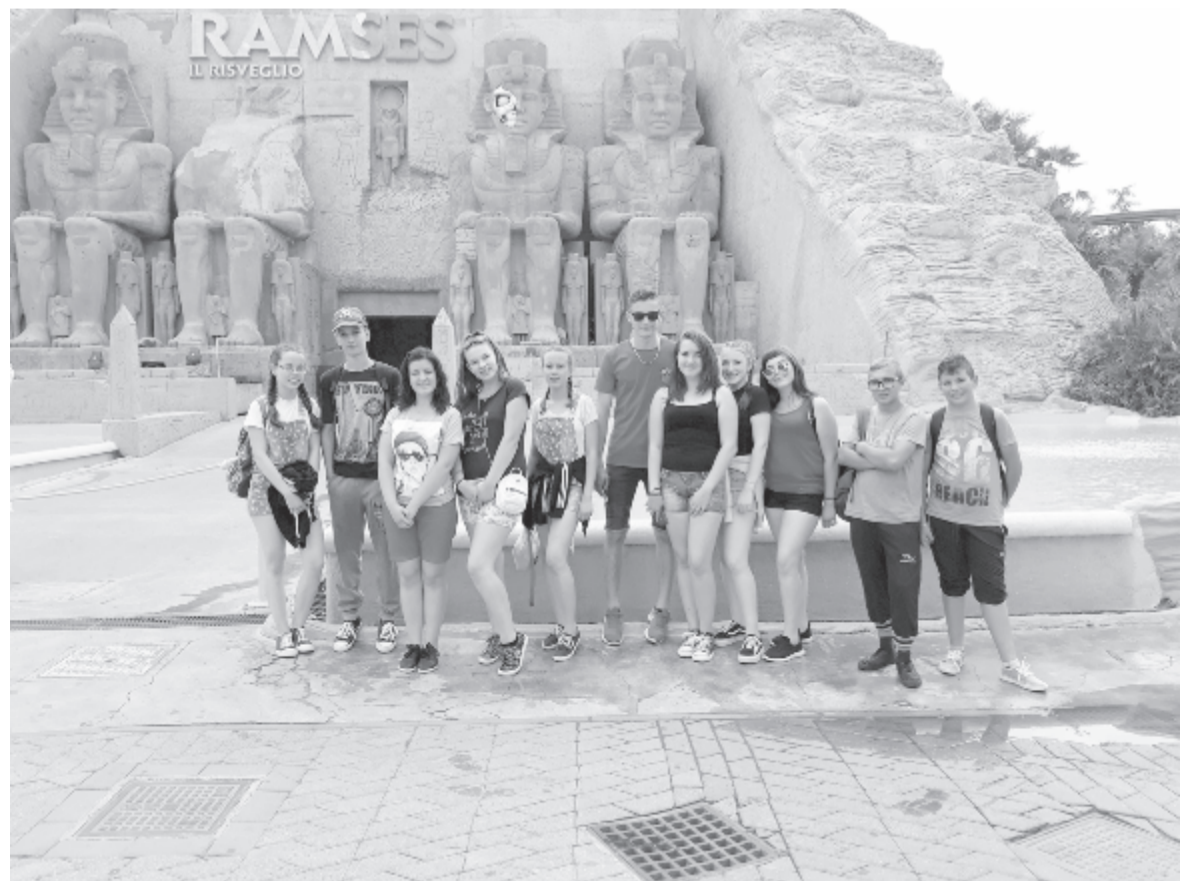
Csodálatos napokat töltöttek európai útjukon a fiatalok